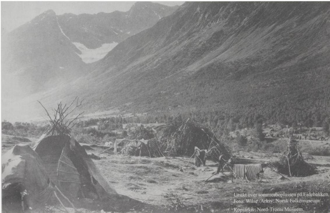
Figur 5 Samisk boplass på Fjellfinnbakken. Wilse ca. 1900. Norsk folkemuseum.