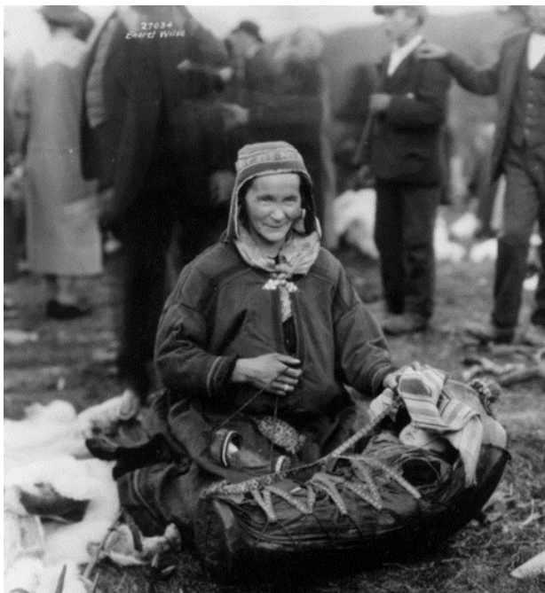
Figur 7 Turister på Fjellfinnbakken i 1925. Wilse. Norsk folkemuseum.