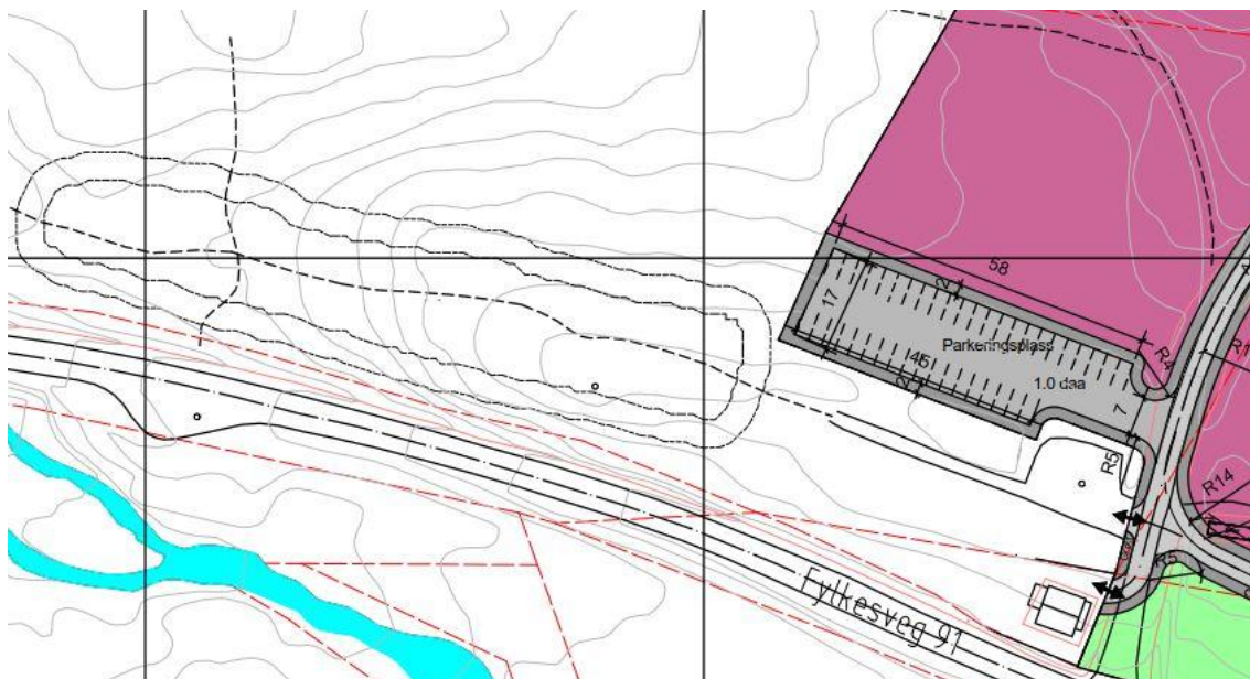
Figur 4 Utsnitt fra plankart viser tiltakets nærhet til Fjellfinnbakken (grå stiplet avlang lokalitet med sikringssone).

Fjellfinnbakken er en tidligere sommerboplass for svenske flyttsamer. Boplassen er registrert i Askeladden med ID 9070, ligger innenfor influensområdet til tiltaket. Nærheten er vist på figuren under.