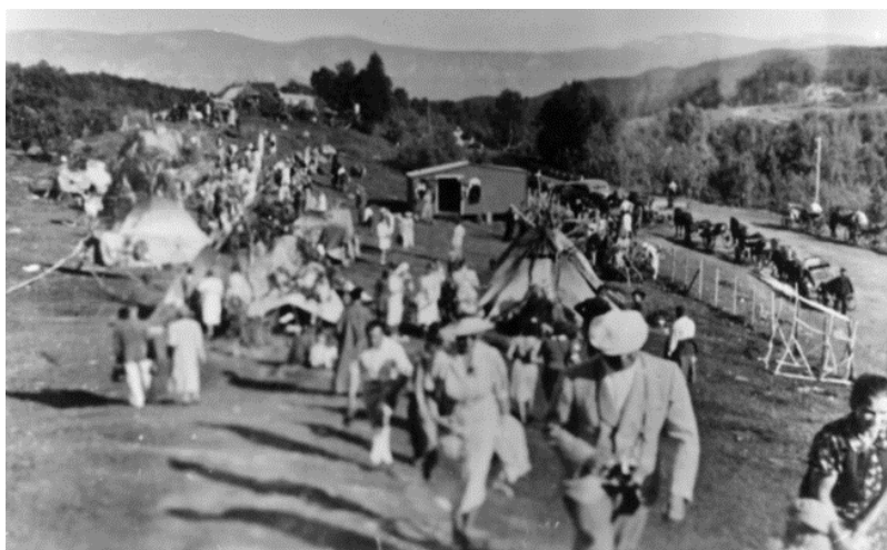
Under: Figur 8 Fjellfinnbakken i 1950-1960-tallet.

Kulturminnet er vurdert til å ha stor nasjonal og lokalhistorisk verdi. Det er fremdeles synlige tufter i området. Den har også stor kunnskapsverdi og opplevelsesverdi for formidling av lokalhistorie.