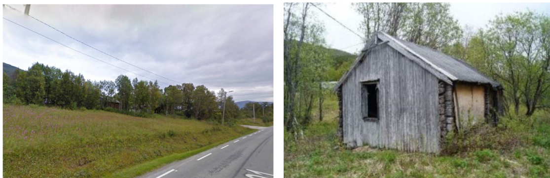
Figur 1 og 2 Skomakergården er ikke særlig synlig fra veien. Venstre: husene fra veien. Høyre: SEFRA-bygning 202-22.

Fylkeskommunen har påpekt at bygningene er av en viss alder og er SEFRAK-registrerte.