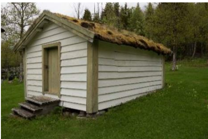
Figur 11 Beinhuset. Sametinget 2015