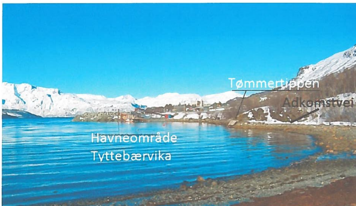
Oversiktsbilde av Tyttebærvika sett mot vest.

Fra tidligere er fiskerne/fritid ikke blitt hørt i reguleringsarbeide i Tyttebærvika slik havne- og farvannsloven tilsier, denne praksisen kan ikke fortsette slik at det ikke lenger er mulig å drive fiskeri og fortøye båter der. (Se Lov om havner og farvann (havne- og farvannsloven) ). Fiskeri-/fritidsinteressert vil derfor fremme innsigelser på at det blir ytterlige innskrenkninger av havneområde og bruken av det for fiske-/fritidsbåter, og at det tilrettelegges for adkomst, flytebrygge/ kai for fiske- og fritidsbåter.