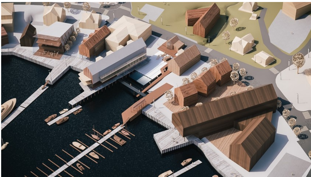
Figur 2 Illustrasjon 3D modell, Strandveien og sjøfronten, Arkitektgruppen CUBUS