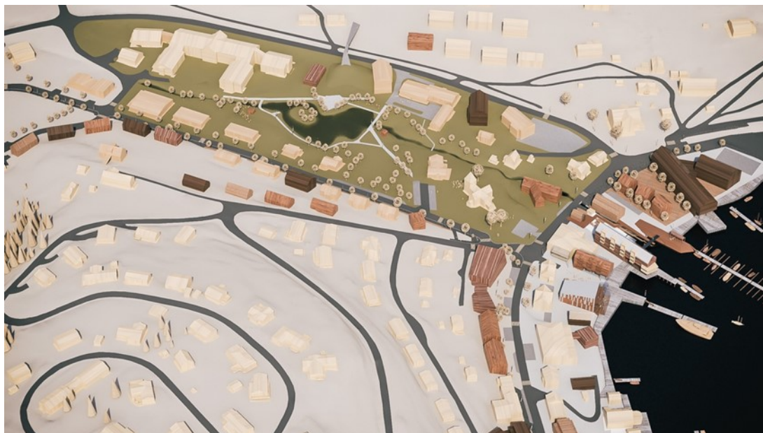
Figur 3 Illustrasjon 3D modell, Kirken, Prestelvparken, Parkveien, Giævergården Arkitektgruppen CUBUS