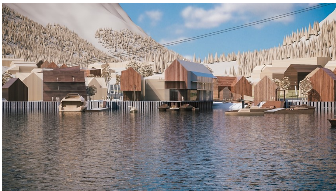
4 Illustrasjon 3D modell, Lyngnhuset, promenade, Elektro-Sport, Slippen, allemninger. Arkitektgruppen CUBUS