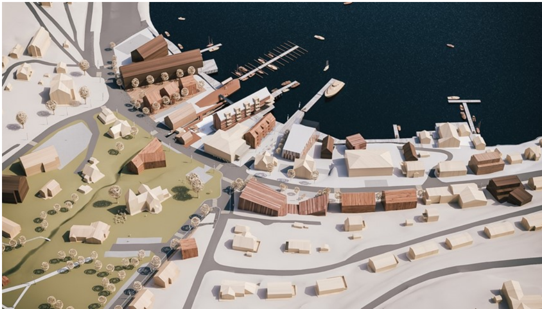
Figur 1 Fremtidsbilde sentrum: Aktiviteter og program på Lyngseidet, Arkitektgruppen CUBUS