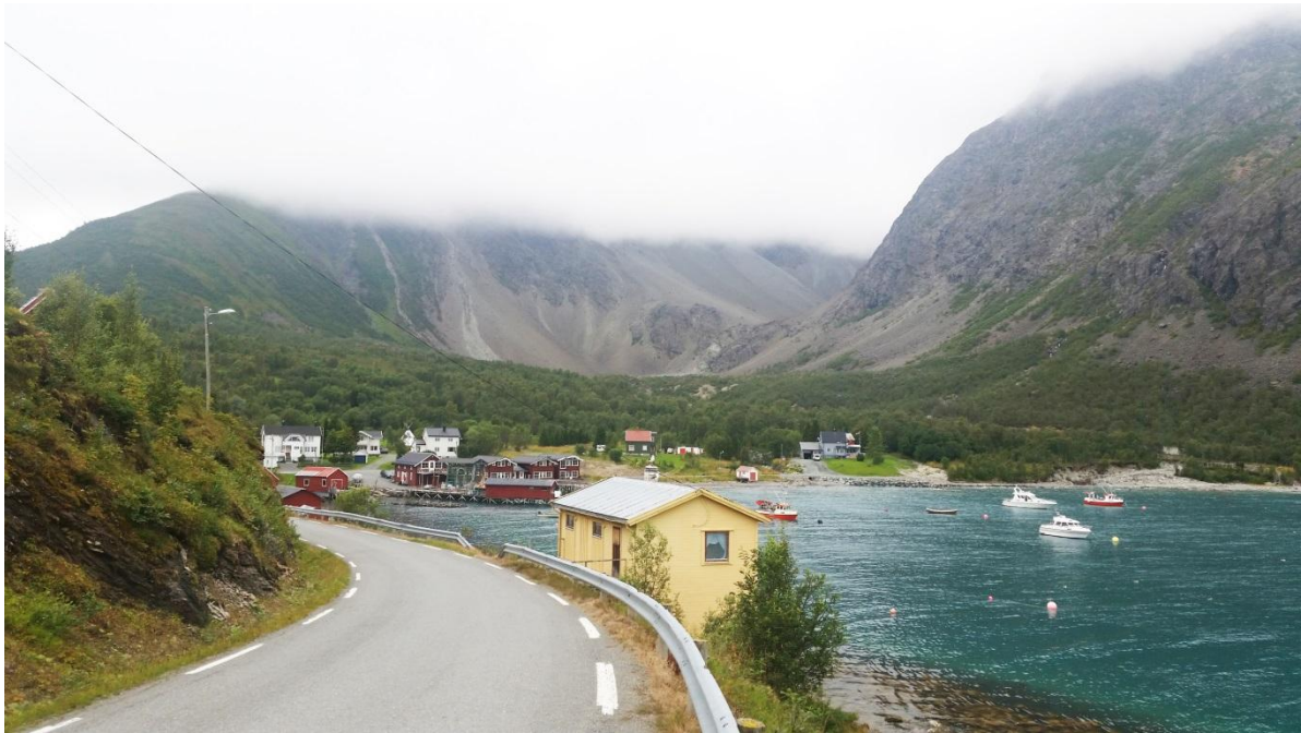
Figur 4 Bildet viser selve Koppangen og den markante skålforma terrenformen.

På nordsida av elva ligger lauvtre vegetasjonen som et grønt belte mellom den grå grusen og steinene ved elva, og fjellet som reiser seg opp fra dalen. På sørsida av elva finner vi en morenerygg delvis dekt av skog. Denne ligger opp mot fjellryggen bakenfor og nedenfor brer lauvskogen seg ned mot bygda og fjorden. Nede i bygda er det tradisjonelle kulturlandskap som preger området. Nede ved strandkanten finner vi brygger, naust og husene ovenfor. Bebyggelsen ligger forholdsvis tett og all bebyggelse ligger på sørsiden av elva. Turistanlegget som finnes der i dag glir fint inn i resten av omgivelsene og er oppført i materialer og form som utgjør en naturlig del av den eksisterende bygningsmassen. Ovenfor og mellom husene ligger dyrkamarka. Deretter tar lauvskogen over opp mot fjellet her er området er prega av gjengroing. Innimellom trærne finner man spor av tidligere kulturlandskap og sommerfjøs.