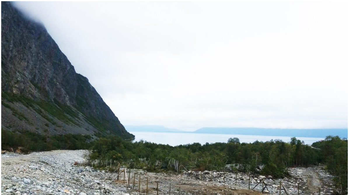
Figur 3 Bildet viser flomvernet og reingjerdet.

Elva tar deretter en sving mot nord før den renner ned til fjorden. Områdene rundt elva består av stein og grus. Noe av dette er et resultat av et Jøkhulaup som gikk våren 2013. Det er formet et flomvern av stein og grus som følger sørsiden av elva ned mot fjorden. Sør for flomvernet finner man reingjerdet som leder fra prammingsplassen nede i fjæra og videre innover mot fjellet. Strandsonen nærmest elva bærer preg av flommen og består av mye grus og stein.