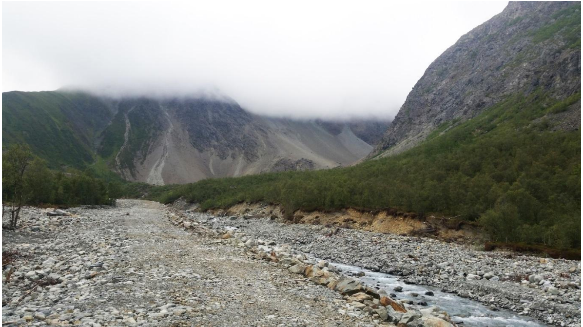
Figur 2 Bildet viser elva og flomvernet

Elva tar deretter en sving mot nord før den renner ned til fjorden. Områdene rundt elva består av stein og grus. Noe av dette er et resultat av et Jøkhulaup som gikk våren 2013. Det er formet et flomvern av stein og grus som følger sørsiden av elva ned mot fjorden. Sør for flomvernet finner man reingjerdet som leder fra prammingsplassen nede i fjæra og videre innover mot fjellet. Strandsonen nærmest elva bærer preg av flommen og består av mye grus og stein.