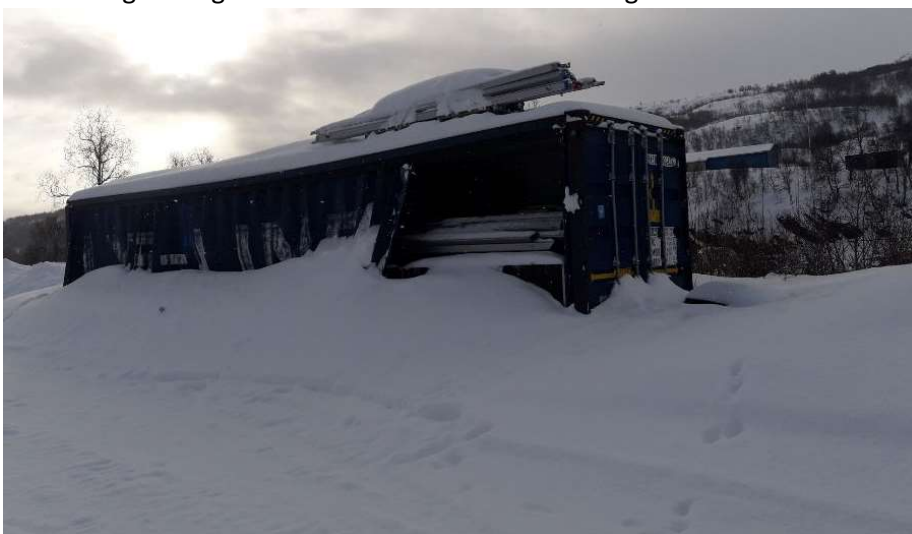
Parkeringsplass ved Lyngenhallen: konteiner med festivaltelt

Kommunen har de senere år gjort innkjøp av festivaltelt og mobil sene med tilhørende utstyr. En del av dette er materiell som ikke er egnet til å lagres ute. Da kommunen ikke har mulighet for å lagre dette innendørs i egne lokaler er det inngått avtale om leie av garasje til sceneutstyr. Kontainer med festivaltelt oppbevares i dag på parkeringsplass ved Lyngenhallen, men dette er lite egnet da konteiner ikke lar seg låse og dermed er svært utsatt for vær og vind samt hærverk.