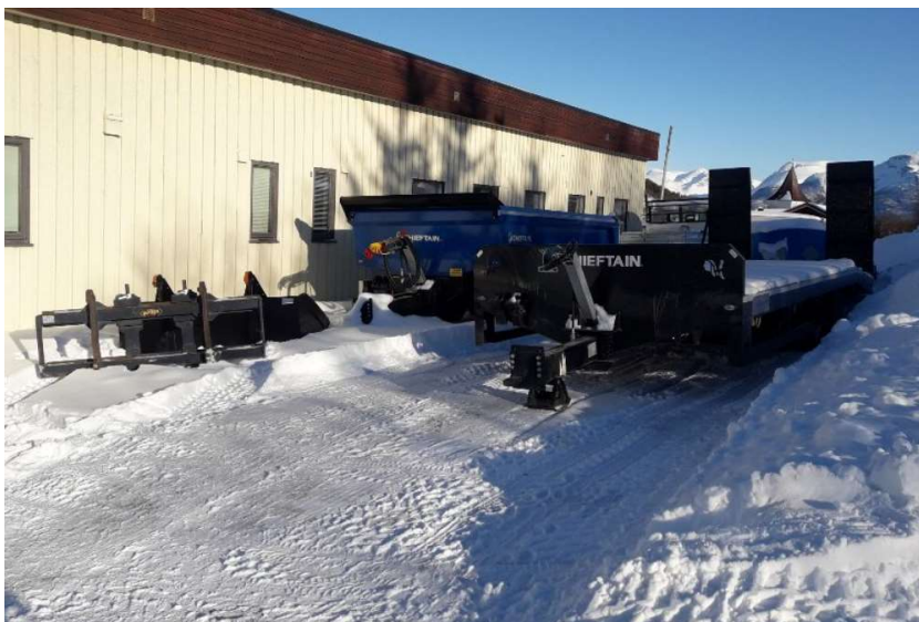
Utendørs lagerplass ved Mestagarasjen