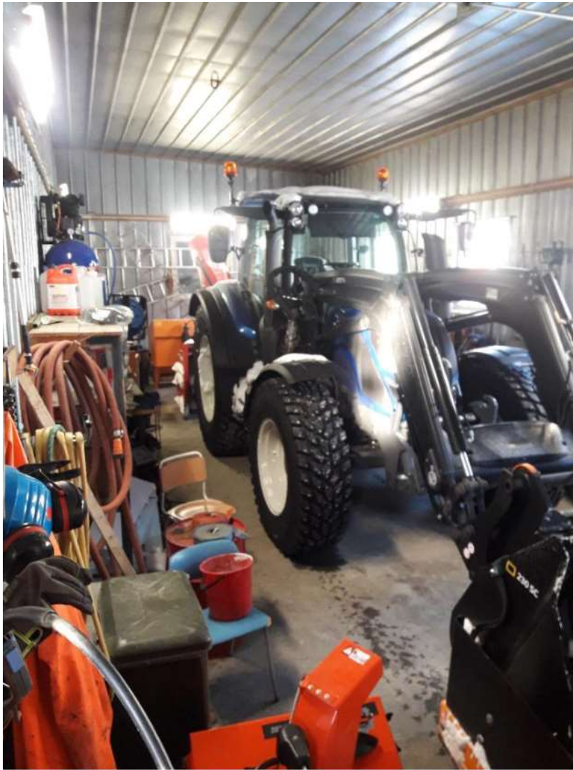
Innendørs plass for service og vedlikehold oppleves som mangelfull, her fra Mestagarasjen