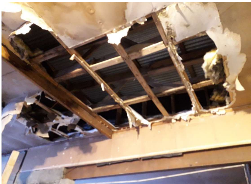
Lager Kjosen: taktekke bør skiftes og forsterkes snarest

Bygningens tilstand er av en slik art at denne ikke utgjør noen stor verdi, det må påregnes utgifter på kr 300 000 senest i 2020 til nytt taktekke og forsterkning av takkonstruksjonen.