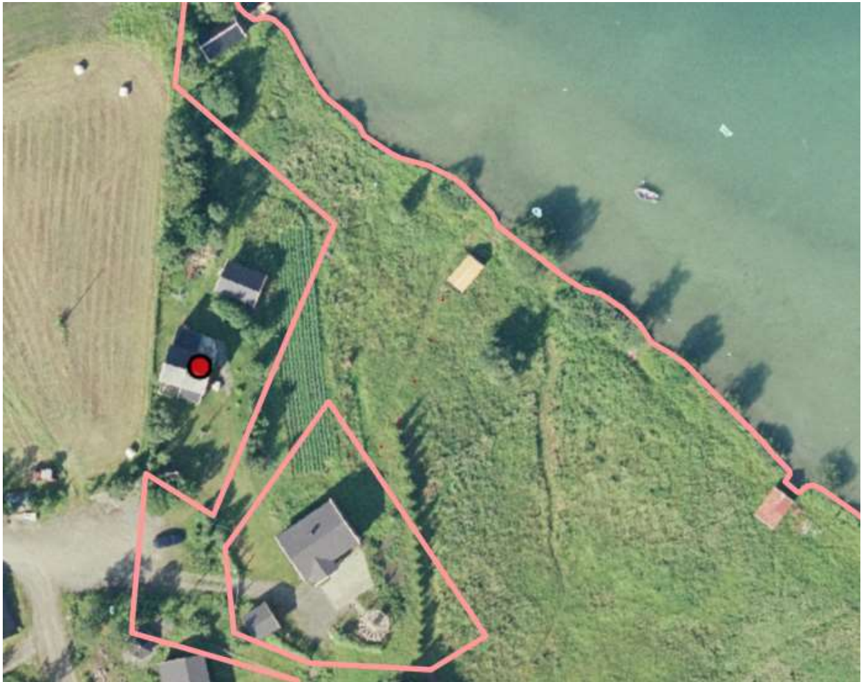
Samme bilde uten markslag, Nibo 2004. Her ser vi tydelig en adkomstvei til nauset.