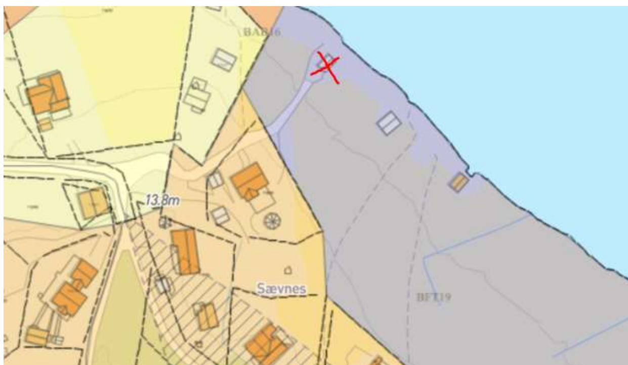
Figur: Kommuneplanens arealdel 2017-2029 – Utsnitt fra Jægervatn, eiendom 118/7.

Det sto et naust her fra tidligere. Denne var falleferdig og eier fjernet denne og førte opp et nytt naust på samme sted. I tillegg oppgraderte han adkomsten ned til naustet med påføring av nye masser.