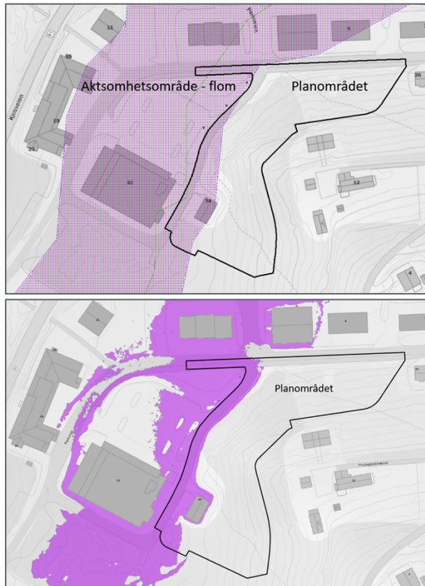
Figur 1. Aktsomhetsområde for flom (NVE Atlas). Modellert flomsonekart 1000-årsflom med klimapåslag og usikkerhetspåslag under (Multiconsult 2025).